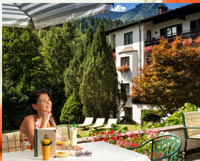
Hotelgarten im St. Georg.