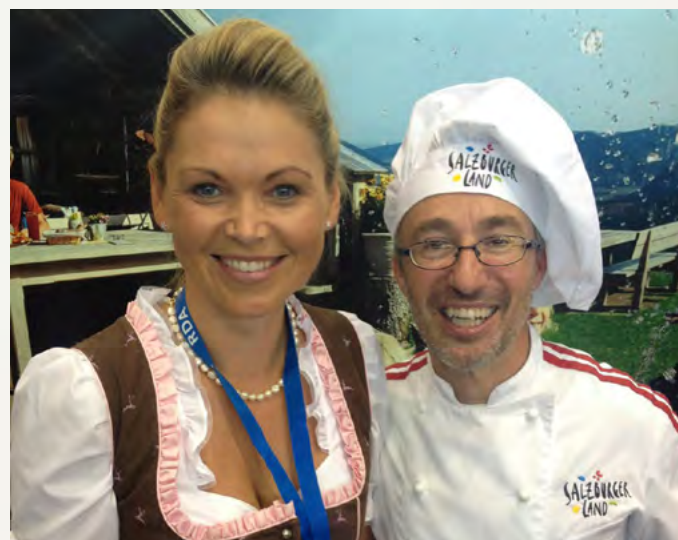
Messeauftritt der 7 Johannesbad Hotels bei der RDA Messe in Köln.